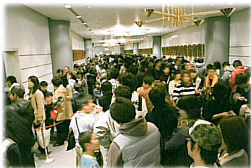
トロフィー見学の行列

2009WBC優勝トロフィーは、3月25日に凱旋帰国した日本代表とともに日本へ到着。同夜の帰国会見で、それまで当館で展示していた前回2006WBC優勝トロフィーと並べて展示されました。そして、翌26日の午前9時30分過ぎ、2006、2009の2つのトロフィーと一緒に当館に到着。すぐにエントランスホールのWBC特別展示コーナーに並べて展示し、当日の開館10時より公開しました。また、2009決勝戦、第2戦韓国戦、初戦中国戦の3つのウイニングボールも併せて展示しました。