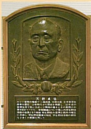
1973年殿堂入り 天野 貞祐氏レリーフ