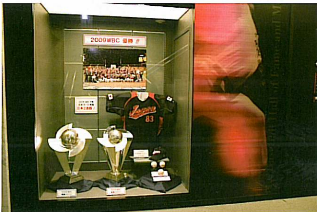
左・2006年 右・2009年の優勝トロフィー（4月2日まで）

NPBをはじめ関係各位の迅速かつ絶大なご尽力により、記者会見の翌日の3月26日からWBCのトロフィーを展示できることになりました。トロフィーに対する関心の高さは圧倒的で、4月2日までの8日間で入館者は25,405人を記録し、これは年間入館者の5分の1に相当する人数であり、博物館開館以来の快挙となりました。