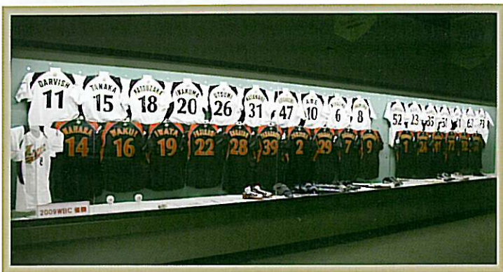
常設展示 日本代表コーナー