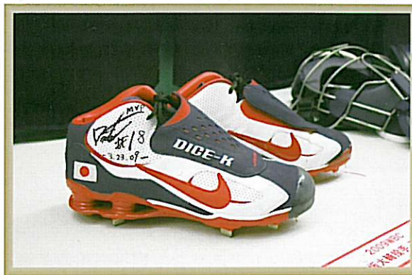
松坂投手スパイク

原 道大選手のスパイクに加え、侍ジャパンのサインボール、王 貞治前監督と原監督のサインボール、優勝記念キャップとTシャツも同時に展示しました。この展示は翌27日の開館から公開となり、ファンの絶好の撮影スポットとなっております、人気を集めています。